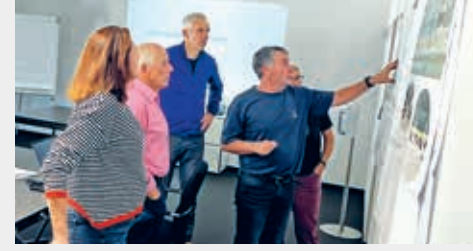
Angeregter Austausch in einer der Arbeitsgruppen

Mit einem neuen regionalen Entsorgungshof Balmgieter soll die Abfallentsorgung für Bürgerinnen und Bürger in Zukunft noch effizienter und vielseitiger angeboten werden. Der Entsorgungshof garantiert einen nachhaltigen und schonenden Umgang mit vorhandenen Ressourcen, gemäss den übergeordneten Vorgaben.