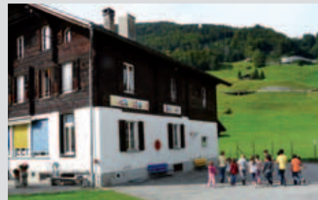
Verkauf Schulhaus Brünigen.