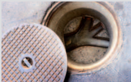
Übernahme altrechtliche Abwasserleitungen.

ihre Leitungen gemäss den Vorgaben der Gemeinde zu sanieren. Doch sind damit verschiedene Probleme verbunden: Seit 1971 wurde viel gebaut. Liegenschaftsbesitzer haben im Einverständnis der Gemeinde und ohne Absprache mit den Eigentümern an Privatleitungen angeschlossen. Eine finanzielle Entschädigung wurde nicht vereinbart.