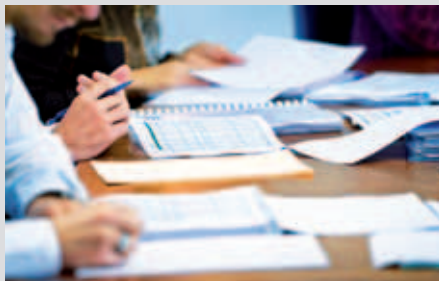
Anpassungen im Reglement Pauschalentschädigungen.