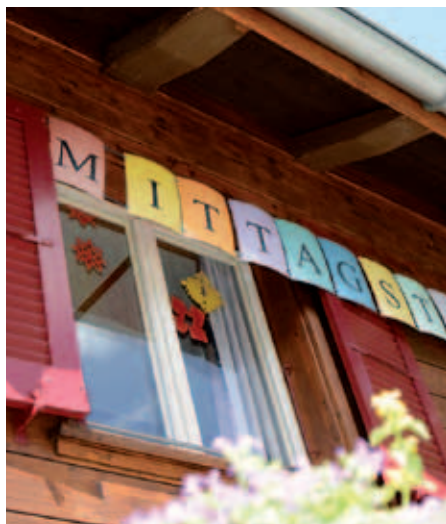
Einladend: Mittagstisch & Co. an der Lengasse.

Verpflegung sowie eine einkommensabhängige Gebühr pro Betreuungsstunde.